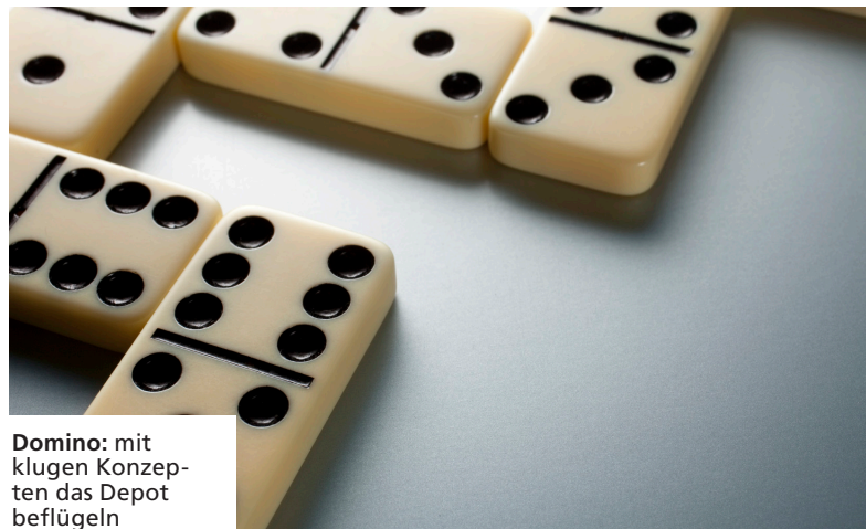
Domino: mit klugen Konzepten das Depot beflügeln

Vielen Anlegern fehlt es oft an Zeit und Wissen, sich in der Welt der Geldanlage zurechtzufinden. Verzichten müssen sie aber auf Chancen nicht: Sie können ganz komfortabel auf Fonds setzen.